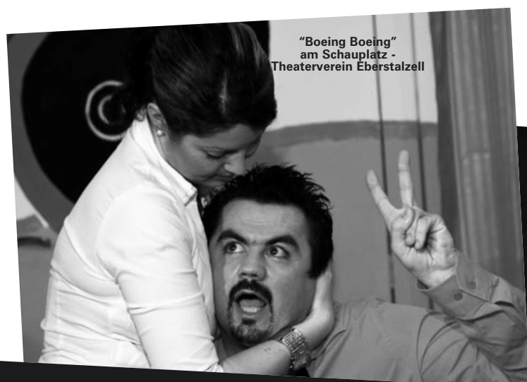
"Boeing Boeing" am Schauspiel - Theaterverein Eberstalzell