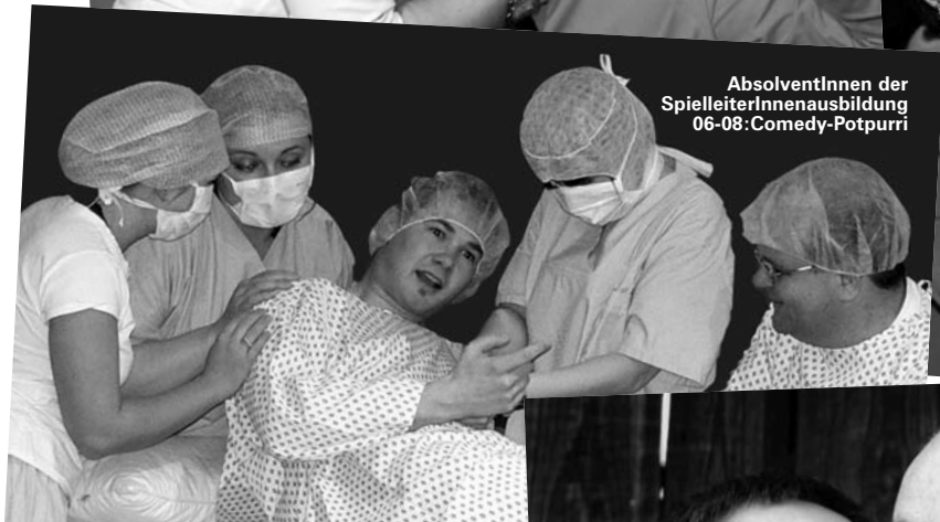
AbsolventInnen der SpielleiterInnen Ausbildung 06-08: Comedy-Potpurri