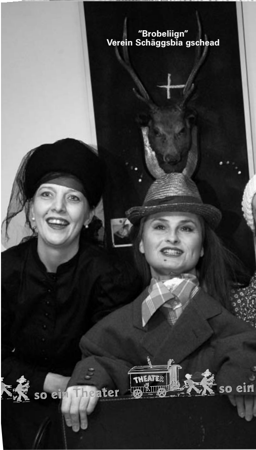
"Brobeliagn" Verein Schäggsbia gschead