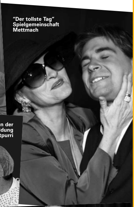
"Der tollste Tag" Spielgemeinschaft Mettmach