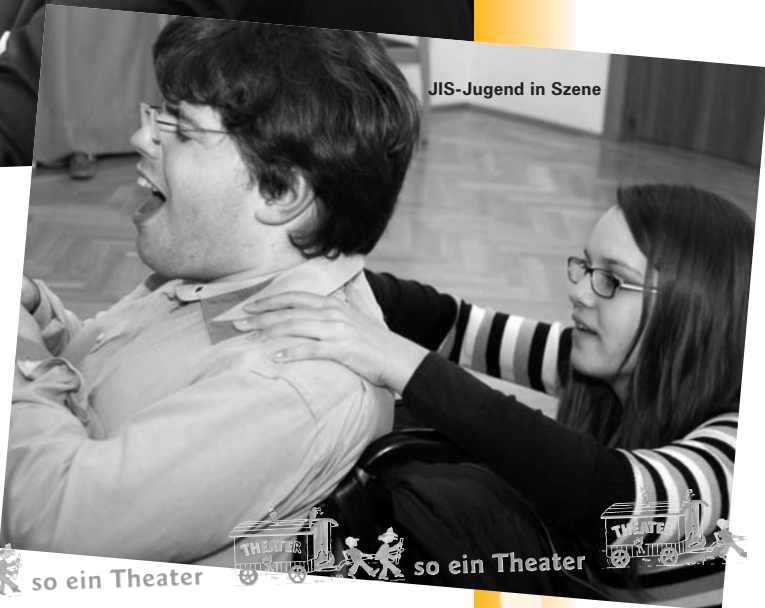
JIS-Jugend in Szene